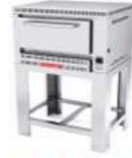
PIZZINO 1 PETIT

Horno a gas, dos gavetas, capacidad total de 10 charolas de 65x45 cm, controlado por 2 termostatos análogos