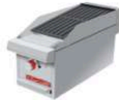
ACV 1 MASTER

Asador a gas, 4 parrillas reversibles, área útil frente: 0.290 m, fondo: 1.16 m y 1 capa de piedra volcánica refractaria