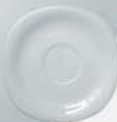
PLATO PARA TAZA CAFÉ CUADRADA SAUCER CPPT90 (90 cc.) CPPT170 (170 cc.) CPPT230 (230 cc.)