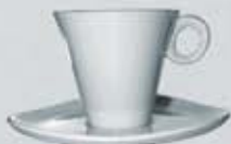
JGO. TAZA ALTA XO Y PLATO TRIÁNGULO CUP + SAUCER TTAP210 (210 cc.)