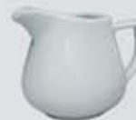
JARRITA CREMERA-LECHERA CREAMER DJC150 (150 cc.) DJL280 (280 cc.)