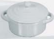
CAZUELITA MEDIANA REDONDA CON ASAS Y TAPA ROUND BOWL WITH HANDLES + LID ACMOT11 (8x4 cm. - 80 cc.)