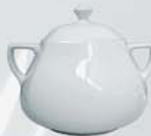
SOPERA CON TAPA SOUP TUREEN + LID DESTC (3.200 cc.)