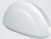
SERVILLETERO NAPKIN HOLDER DSV