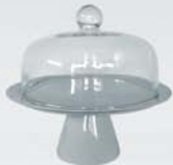
PASTELERA CON BASE Y CAMPANA DE VIDRIO CAKE STAND WITH GLASS COVER APABCV36 (36 cm.)