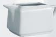
SALSERA RECTANGULAR CON ASA RECTANGULAR SAUCE BOWL WITH HANDLE ASRA (300 cc.)