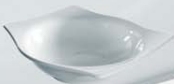
ENSALADERA RECTANGULAR SALAD BOWL OER28 (28 cm.)