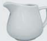
JARRITA CREMERA-LECHERA CREAMER DJC150 (150 cc.) DJL280 (280 cc.)