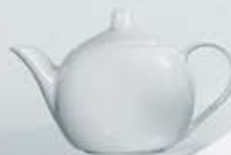
TETERA - CAFETERA ESFERICA JAZZ CON TAPA TEA - COFFEE POT + LID JZTTE380 (380 cc.) JZCTE1100 (1.100 cc.)