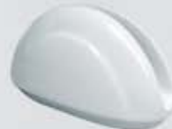
SERVILLETERO NAPKIN HOLDER DSV