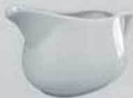
SALSERA CON ASA SAUCEBOAT DSA (400 cc.)