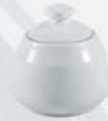
AZUCARERA REDONDA CON TAPA SUGAR BOWL + LID DAT