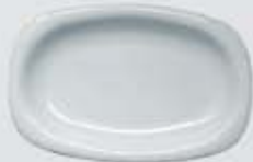
PLATÓN RECTANGULAR RECTANGULAR PLATE DEPR29 (29 cm.) DEPR34 (34 cm.) DEPR39 (39 cm.)