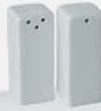
JUEGO DE SALERO Y PIMENTERO CUADRADO SQUARE SALT + PEPPER SHAKER AJSPC