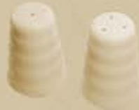
▶ PIMENTERO-SALERO PEPPER SHAKER - SALT SHAKER RBPIM RBSAL