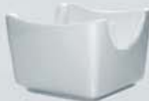
AZUCARERA SOBRES CUADRADA SQUARE SUGAR BOWL AASC (7.5x7.5 cm.)