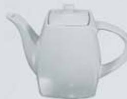
CAFETERA CUADRADA CON TAPA COFFEE POT + LID ACCT1200 (1.100 cc.)