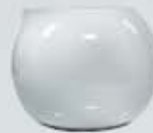
JARRITA LECHERA ESFÉRICA CREAMER JZJL250E (250 cc.)