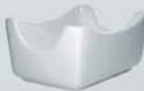
AZUCARERA SOBRES RECTANGULAR RECTANGULAR SUGAR BOWL AASR (11x7.5 cm.)