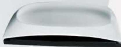
PLATÓN RECTANGULAR CON BASE RECTANGULAR PLATE + WOODEN STAND CVPRB3117 (31x17.5 cm.) CVPRB3621 (36x21 cm.) CVPRB4425 (44x25 cm.)