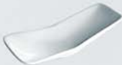
CUCHARA DEGUSTACIÓN RECTANGULAR RECTANGULAR SPOON ACDR (15x8 cm.)