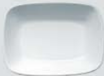
PLATÓN RECTANGULAR HONDO DEEP RECTANGULAR PLATE DEPRH14 (14 cm. - 150 cc.) DEPRH17 (17 cm. - 250 cc.) DEPRH20 (20 cm. - 450 cc.)