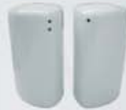
PIMENTERO-SALERO PEPPER SHAKER-SALT SHAKER TPIM TSAL