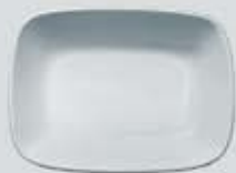
PLATÓN RECTANGULAR HONDO DEEP RECT. PLATE DEPRH14 (14 cm. - 150 cc.) DEPRH17 (17 cm. - 250 cc.) DEPRH20 (20 cm. - 450 cc.)