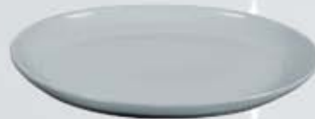
PLATÓN OVALADO OVAL PLATTER APO3727 (37x27 cm.) APO4231 (42x31 cm.)