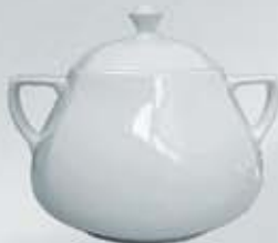
SOPERA CON TAPA SOUP TUREEN + LID DESTC (3.200 cc.)