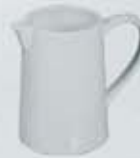
JARRITA LECHERA RECTA CREAMER- MILK POT AJLR100 (90 cc.) AJLR500 (400 cc.) AJLR1100 (700 cc.)