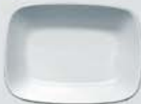
PLATÓN RECTANGULAR HONDO DEEP RECTANGULAR PLATE DEPRH14 (14 cm. - 150 cc.) DEPRH17 (17 cm. - 250 cc.) DEPRH20 (20 cm. - 450 cc.)