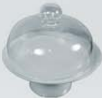
PASTELERA CON BASE Y CAMPANA DE VIDRIO CAKE STAND WITH GLASS COVER APABCV24 (24 cm.)