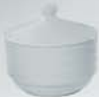
AZUCARERA CON TAPA SUGAR BOWL + LID RAT (11 cm.)