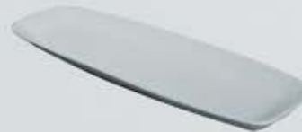
PLATÓN OVALADO OVAL PLATTER APO6121 (61x21 cm.)