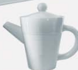
CAFETERA CONICA ANILLADA CON TAPA COFFEE POT + LID ACCAT1000 (600 cc.)