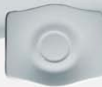
PLATO RECTANGULAR PARA TAZA SAUCER OPTR210 (15.5 cm.)