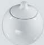
AZUCARERA ESFÉRICA CON TAPA SUGAR BOWL + LID JZATE (250 cc.)