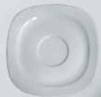
PLATO PARA TAZA CAFÉ CUADRADA SAUCER DEPC90 (90 cc.) DEPC170 (170/230 cc.)