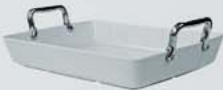
FUENTE RECTANGULAR CON ASAS METAL RECT. TRAY WITH METAL HANDLES AFRAM3426 (34x26x6 cm.)