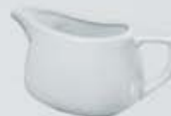
SALSERA CON ASA SAUCEBOAT DSA (400 cc.)