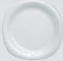
PLATO PASTEL-TRINCHE FLAT PLATE CPPT18 (18 cm.) CPPT20 (20 cm.) CPPT25 (25 cm.) CPPT27 (27 cm.) CPPT30 (30 cm.)