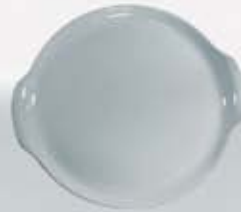
PLATÓN PASTELERO RED. CON ASAS CAKE PLATE WITH HANDLES APPA32 (32 cm.) APPA36 (36 cm.) APPA37 (37 cm.)