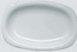
PLATÓN RECTANGULAR RECTANGULAR PLATE DEPR29 (29 cm.) DEPR34 (34 cm.) DEPR39 (39 cm.)