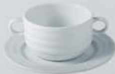
JGO. TAZÓN CONSOMÉ CON OREJAS Y PLATO CONSOUMÉ BOWL + SAUCER RTCOP (350 cc. - 18 cm.) RTC012 (350 cc.) RPTC (18 cm.)