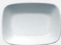
PLATÓN RECTANGULAR HONDO DEEP RECTANGULAR PLATE DEPRH14 (14 cm. - 150 cc.) DEPRH17 (17 cm. - 250 cc.) DEPRH20 (20 cm. - 450 cc.)