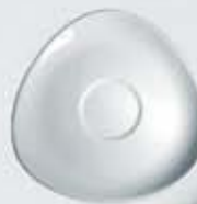
PLATO TRIÁNGULO PARA TAZA SAUCER TPT100 (100 cc.) TPT210 (210 cc.)