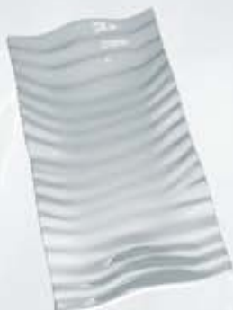
PLATÓN RECTANGULAR RECTANGULAR PLATE APRO139 (13x9 cm.) APRO2013 (20x13 cm.) APRO3020 (30x20 cm.) APRO3215 (32x15 cm.) APRO4125 (41x25 cm.)