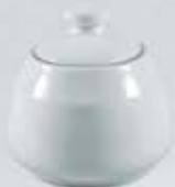
AZUCARERA REDONDA CON TAPA SUGAR BOWL + LID DAT