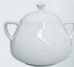
SOPERA CON TAPA SOUP TUREEN + LID DESTC (3.200 cc.)