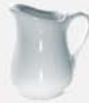
CREMERA CON ASA INDIVIDUAL - CREMERA - LECHERA CLÁSICA CREAMER ACI25 (20 cc.) ACC100 (100 cc.) ALC500 (500 cc.)