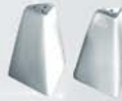
JUEGO DE SALERO Y PIMENTERO PIRÁMIDE PYRAMID SALT + PEPPER SHAKER AJSP