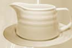
▶ SALSERA + PLATO SAUCEBOAT + SAUCER RBSACP (400 cc. - 18 cm.) RBSA (400 cc.) RBP5A (18 cm.)