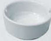
CENICERO ASHTRAY DCE