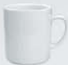
TAZA MUG CUADRADA MUG DEPMC300 (300 cc.)