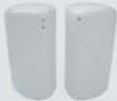
PIMENTERO-SALERO PEPPER SHAKER- SALT SHAKER TPIM TSAL