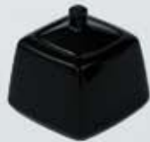
AZUCARERA CUADRADA NEGRA CON TAPA SQUARE SUGAR BOWL + LID AACNT (9x9 cm.)