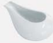
CREMERA CON PICO SIN ASA CREAMER ACP11 (11x8 cm. - 100 cc.) ACP13 (13x9 cm. - 200 cc.)