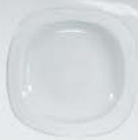
PLATO SOPERO DEEP PLATE DEPSC23 (23 cm.)