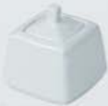
AZUCARERA CUADRADA CON TAPA SQUARE SUGAR BOWL + LID AACT (9x9 cm.)