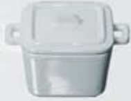
CAZUELITA MEDIANA CUADRADA CON ASAS Y TAPA SQUARE BOWL WITH HANDLES + LID ACMCT11 (9x9x4 cm. - 150 cc.)