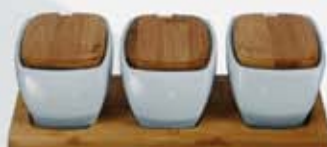
JGO. 3 BOWLS RECT. C/TAPA + BASE DE MADERA 3 RECTANGULAR BOWLS + WOOD TRAY AJ3BTBM (27x10x8 cm.)