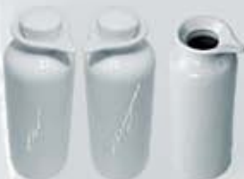
ACEITERA-VINAGRERA-JARRITA + TAPÓN BOTTLE + LID AJPCT (15x5 cm. - 150 cc.) AJP (15x5 cm. - 150 cc.) AJPT