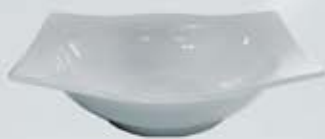
TAZÓN RECTANGULAR SALAD BOWL OTR19 (19 cm.)