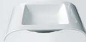
PLATO GRAPA PLATE APG2315 (23x15 cm. - 180 cc.) APG3022 (30x22 cm. - 500 cc.)