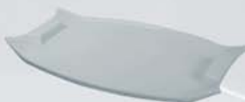
BANDEJA SERVIR OVALADA CON ASAS OVAL TRAY WITH HANDLES ABSOA4628 (46x28 cm.)