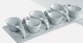
JUEGO DE 6 SALSERAS CON BASE 6 SAUCE BOWLS + TRAY AJ6SB (37x15 cm.)