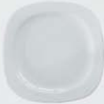
PLATO PAN-PASTEL-TRINCHE-BASE FLAT PLATE DEPTC16 (16 cm.) DEPTC18 (18 cm.) DEPTC21 (21 cm.) DEPTC27 (27 cm.) DEPTC29 (29 cm.) DEPTC32 (32 cm.)