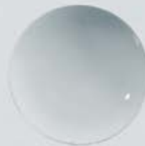
PLATO PASTA O ENSALADERA SALAD BOWL OSPE26 (26 cm.)