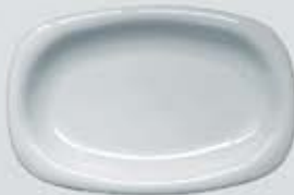
PLATÓN RECTANGULAR RECTANGULAR PLATE DEPR29 (29 cm.) DEPR34 (34 cm.) DEPR39 (39 cm.)