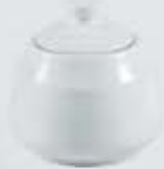
AZUCARERA REDONDA CON TAPA SUGAR BOWL + LID DAT