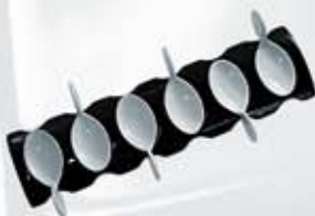
JGO DE 6 CUCHARAS DEGUSTACIÓN OVAL CON BASE NEGRA 6 SPOON + TRAY AJ6CDOB (35x14 cm.)