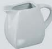
JARRITA LECHERA CUADRADA CREAMER AJLC400 (250 cc.)