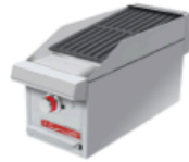
ACV 1 MASTER

Asador a gas, 4 parrillas reversibles, área útil frente: 0.290 m, fondo: 1.16 m y 1 capa de piedra volcánica refractaria