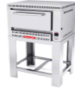
PIZZINO 1 PETIT

Horno a gas, dos gavetas, capacidad total de 10 charolas de 65x45 cm, controlado por 2 termostatos análogos